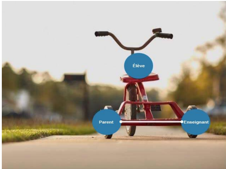
Figure 1 : Triade élève-enseignant-parent

Regroupés sous forme de triade, l'élève, l'enseignant et le parent mettent en œuvre les principes d'apprentissage. La direction et les autres intervenants soutiennent la triade, en fournissant l'environnement propice à la réalisation du programme de formation de l'école québécoise en regard de la mission de l'école. Dans l'intérêt des enfants, tous les acteurs doivent travailler ensemble dans un esprit de collaboration.